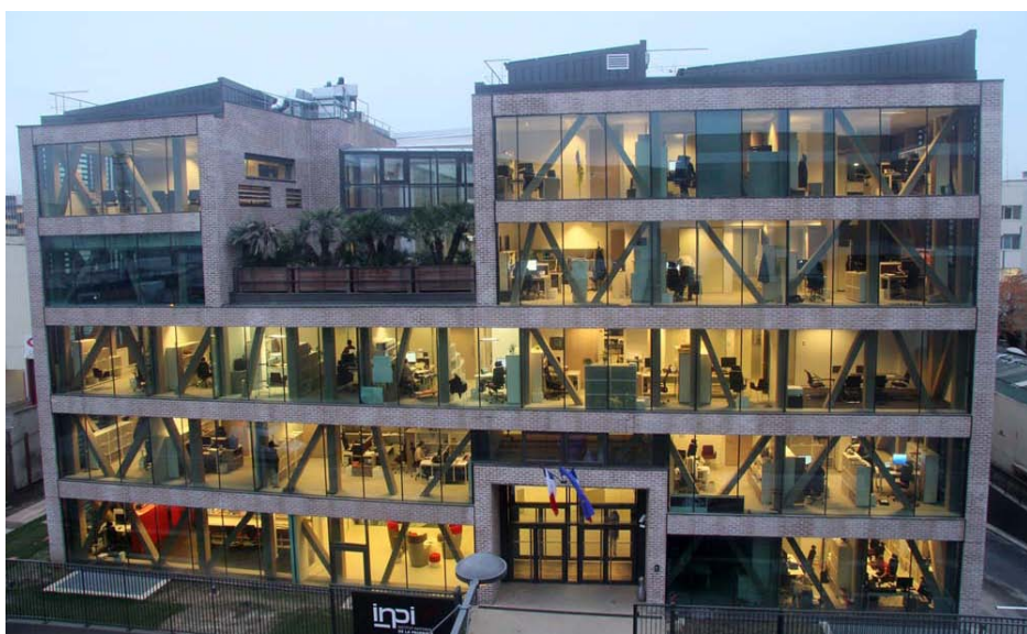
Franck Badaire et Pratik

CATÉGORIE BUREAUX / GRAND PRIX, CATÉGORIE IMMEUBLE NEUF INPI - «PHÉNOMÈNE» 15-19 RUE DES MINIMES, 92400 COURBEVOIE